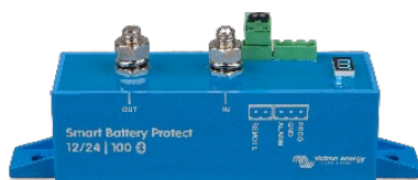
Smart BatteryProtect BP-100