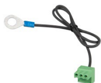
Złącze z fabrycznie zamocowanym ujemnym przewodem prądu stałego (w zestawie)