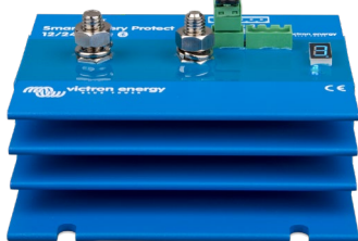
Smart BatteryProtect BP-220